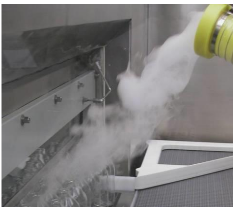
Abströmung in Steriltunnel Flow into Steriltunnel