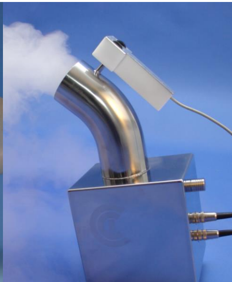
Handy - FOG