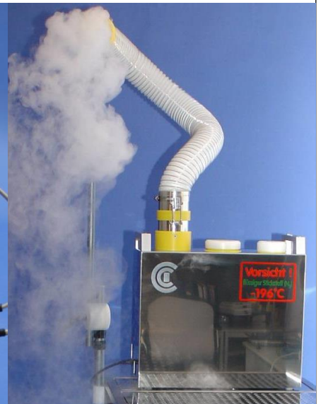
N2 - FOG